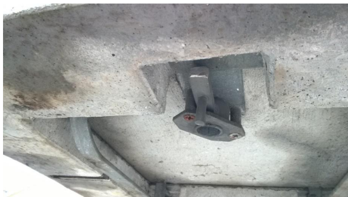
Zdjęcie 1: -Pokrywa PCZsBr