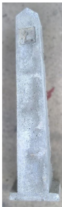
Zdjęcie 1 - Słupek SO