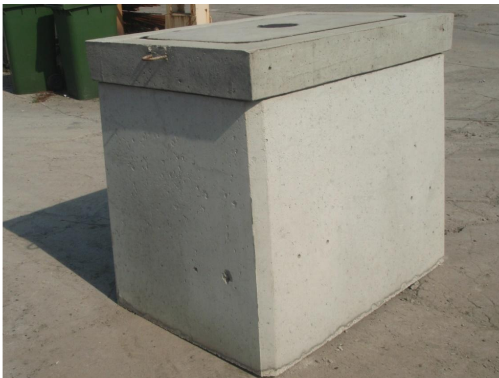
Zdjęcie 1 - Korpus studni kablowej SKO-2g z ramą i pokrywą.