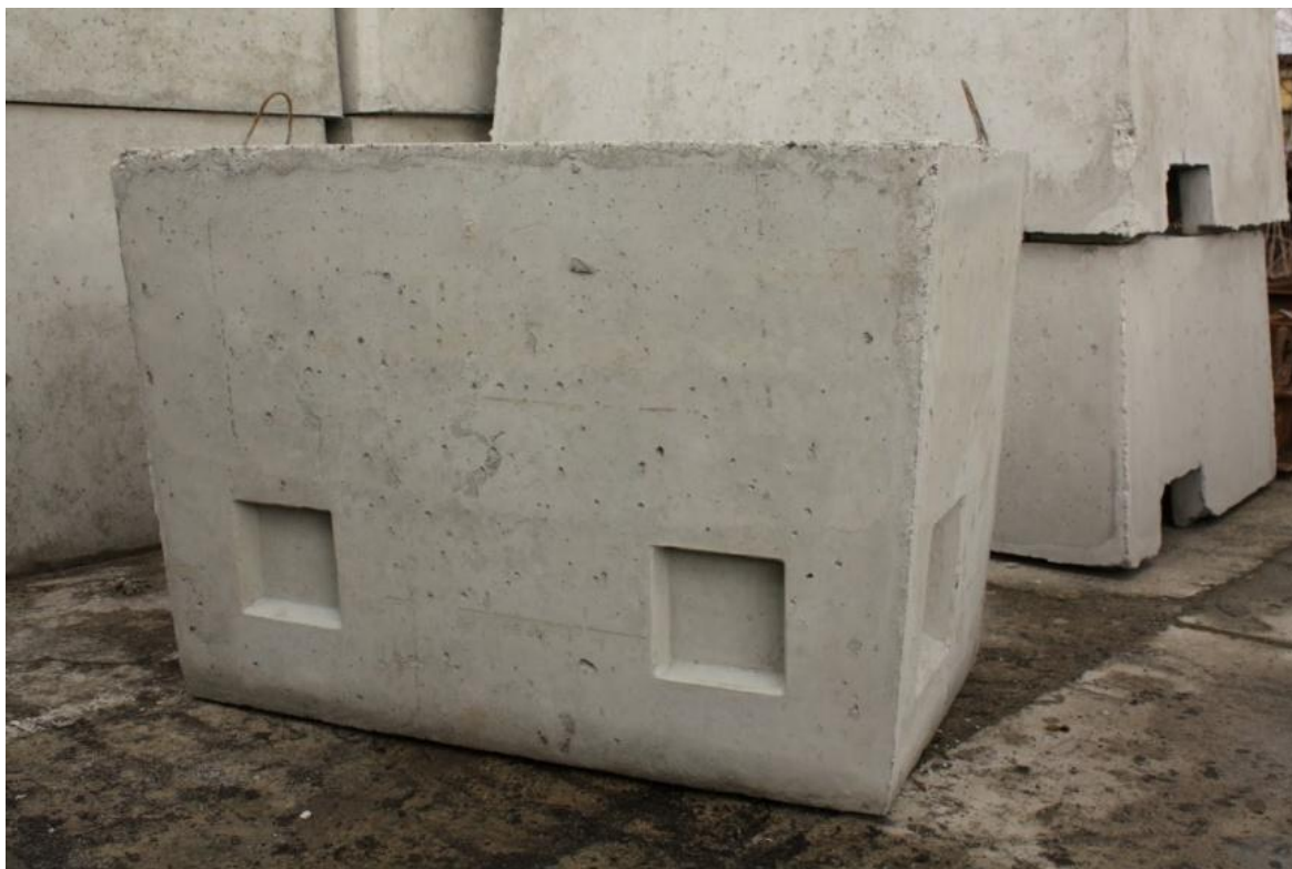
Zdjęcie 1 - Korpus studni kablowej SKR-1